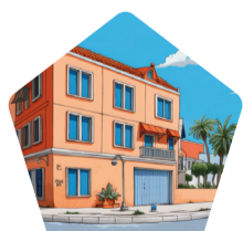
Familie en jeugd