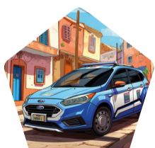
Korps Politie Curaçao